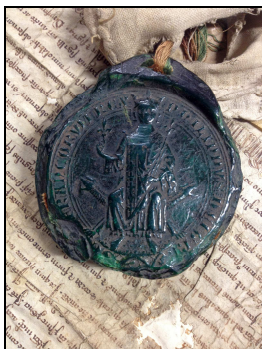
Archives départementales du Gard

E dépôt 1 / 287 : sceau appendu à des lettres patentes du roi Philippe III (1272)