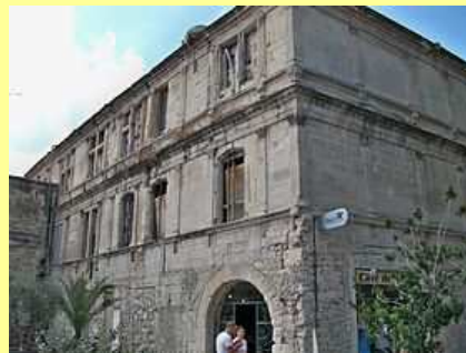
Beaucaire, hôtel de Fermineau

Les façades et toitures de l'hôtel sont inscrites aux Monuments historiques depuis 1935 et un escalier intérieur depuis 1942.