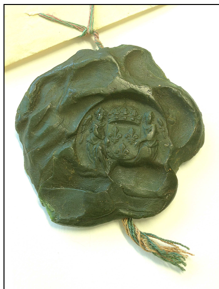
Contre-sceau (AD30/H 751)

Le contre-sceau est le sceau imprimé au revers d'un sceau principal