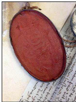
Archives du Gard