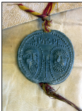
Archives du Gard

Les sceaux des papes sont appelées des bulles* .