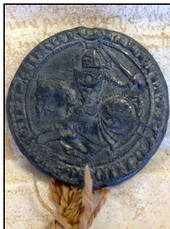
Archives du Gard

Le sceau typique des chevaliers montre un cavalier équipé pour la guerre ou pour la chasse.