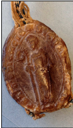
Archives du Gard

Cette forme est réservée aux dames et aux ecclésiastiques.