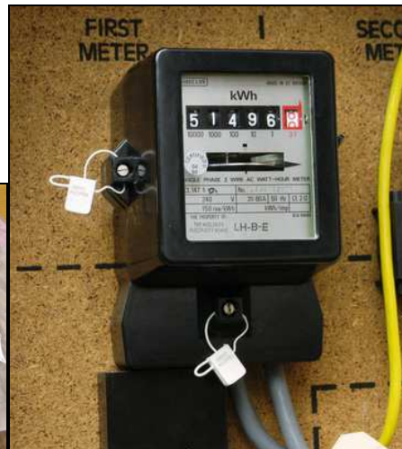
Scellés d'un compteur électrique