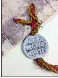
Archives du Gard

H 785 : Bulle* originale d'Innocent III adressé à l'évêque d'Uzès et à l'évêque de Nîmes au sujet d'une plainte de l'abbaye de Saint Gilles contre le comte de Toulouse