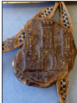
Archives du Gard

G 760 : sceau appendu à une sentence arbitrale portant sur le bornage de la pinède entre les terres de Psalmodi et celles du seigneur d'Uzès et d'Aimargues (1265)