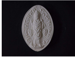
Reproduction en plâtre AN/D 6682 : Pierre III de Mirepoix, évêque de Maguelone (1306)

Il s'agit des sceaux des dames, évêques ou abbés.