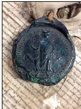
Archives du Gard

Il apparaît assis avec des vêtements civils.