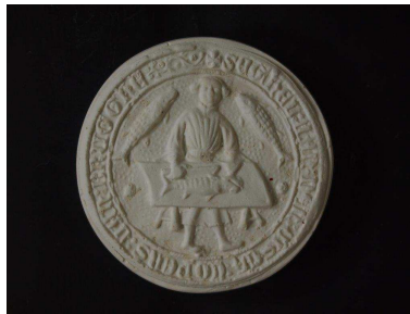
Reproduction en plâtre AN/ F 4757 : les poissonniers de Bruges (1407)