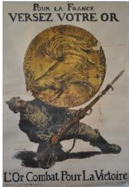
1 er emprunt de la Défense nationale* : Pour la France, versez votre or – L'or combat pour la victoire, 113x79 cm, 1915 - Collection privée