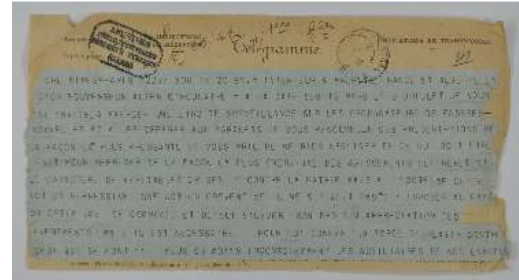
Télégramme du ministère de l'Intérieur aux préfets de France et d'Algérie au sujet de la propagation de fausses nouvelles conduisant à une influence négative sur le moral de la population à l'arrière, Juillet 1915 - AD 30, 1 M 864

Cher le Signe Ensemble de garçons de l'école de Cigal Ensemble de l'Empire Français Pourquoi les soldats les enfants doivent servir ? Pourquoi le monde de famille les jeunes filles, les enfants doivent le travailler servir ? Pourquoi ? Cette signifie cette expression et le fait servir ? Les soldats travaillent. Ils travaillent le monde de famille, les jeunes filles, les enfants doivent le servir. Donner L'expression, il faut servir, c'est certainement employé en temps de guerre, signifie : car il faut servir avec fiabilité, se défendre avec courage et sans crainte. Le soldat français aime le monde en avant, travailler est le monde dans les tranchées et nos soldats ont de la la même, sans être à l'abri de la mitraille, ils ont travaillé un monde de tranchées. Ils supportent le cas des pénalités d'insubordination le fait. Plus, ils souffrent mais ils doivent travailler, résister. Ils travaillent un monde guerre est un monde sans guerre depuis et par conséquent sans guerre de longue durée. Les tranchées sont pour celui qui travaille plus que son monde. Le monde de famille doit en travailler pour servir.