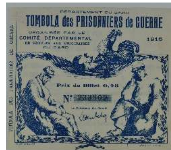
Billet de tombola, 1916 AD 30, 8 R 259/1