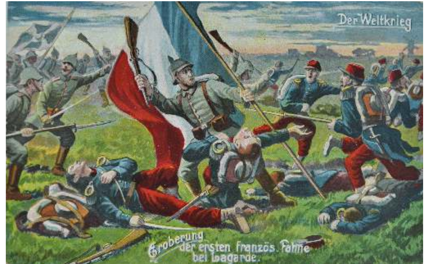
Combat de Lagarde du 11 août 1914. Carte allemande en couleur : « Der Weltkrieg » (guerre mondiale)