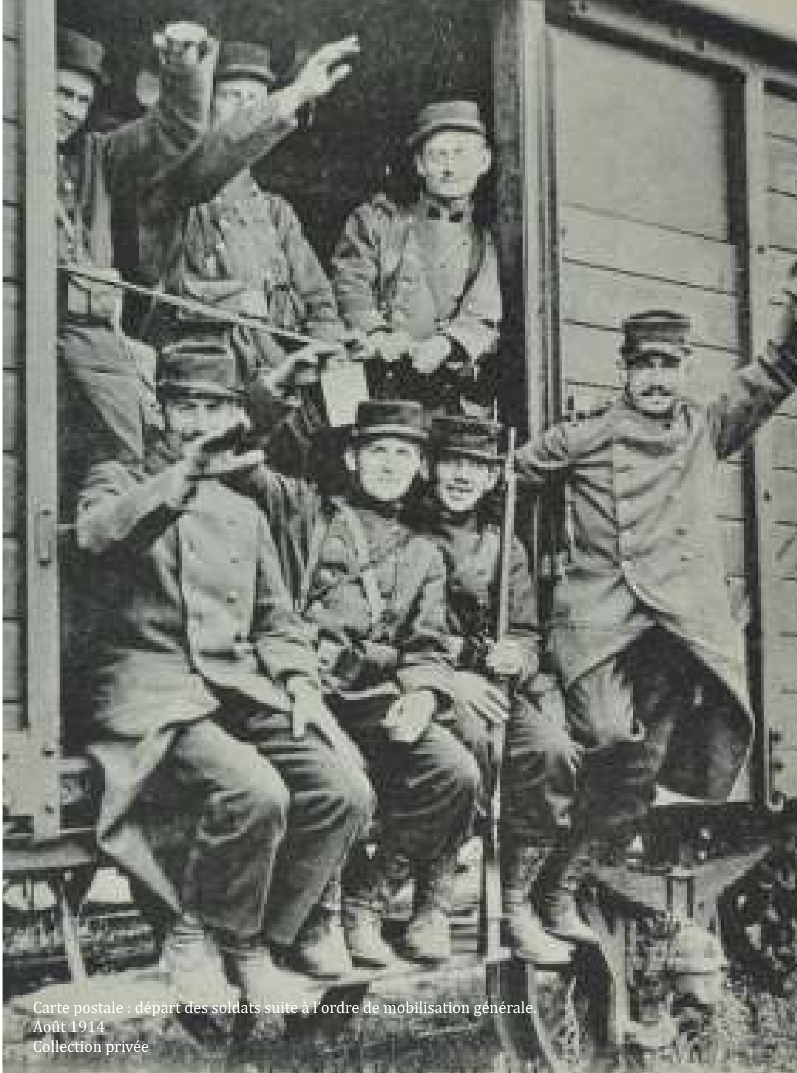
Carte postale : départ des soldats suite à l'ordre de mobilisation générale. Août 1914