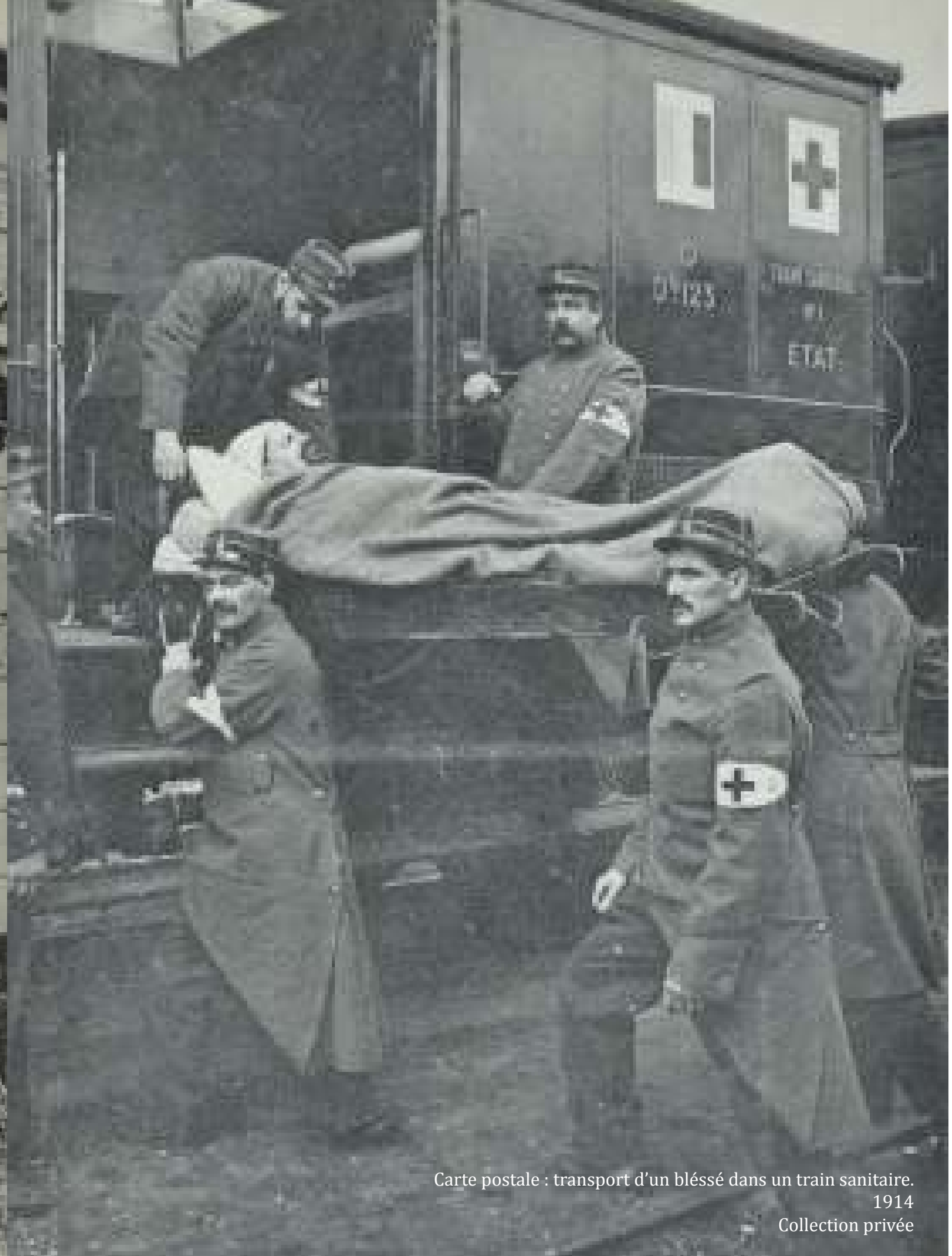
Carte postale : transport d'un blessé dans un train sanitaire. 1914

« Au revoir ! » Le départ joyeux pour le front. « So long ! » A joyful start for the front.